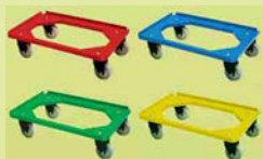
Ref. 203 Base rodante en cuatro colores distintos.