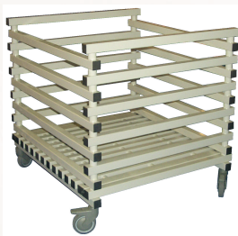
CS 1100 RP