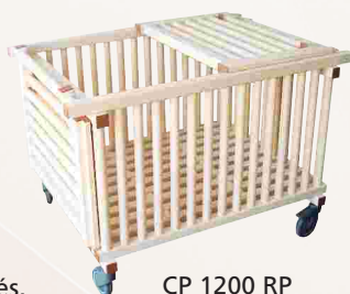
CP 1200 RP