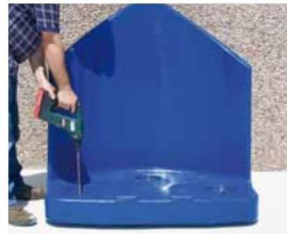
Operación de anclaje fácil y rápida.