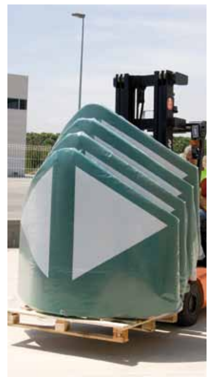
Buena logística: 4 HIMOS de 170cm en una paleta.