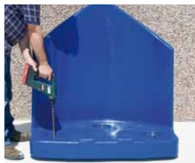
Operación de anclaje fácil y rápida.