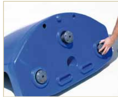
Nivelación por roscado y desenroscado.