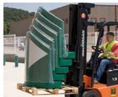
Buena logística: 5 HIMOS de 120cm en una paleta.

Garantía: todos los productos de balizamiento, concebidos y fabricados en España, cumplen con las Normativas españolas vigentes. Certificados de Conformidad y de Garantía disponibles.