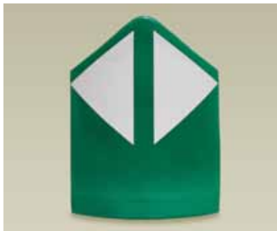
HIMO70: el único hito de vértice en pequeño formato.