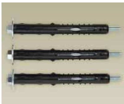
Anclajes de expansión EXP2220: 22x200mm, reforzados con adhesivo monocomponente.