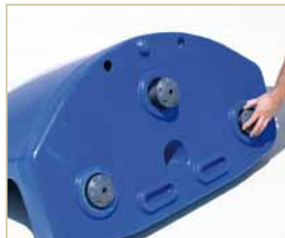
Nivelación por roscado y desenroscado.