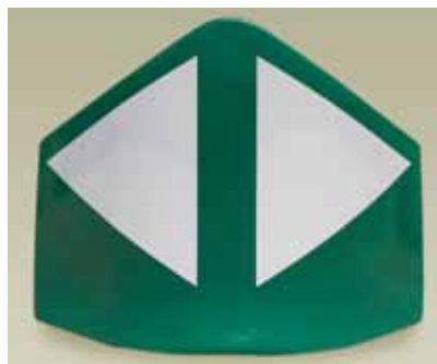
HIMO170: un diseño impecable.

■ Total conformidad a los requisitos exigidos en la Norma UNE 135-360-94.