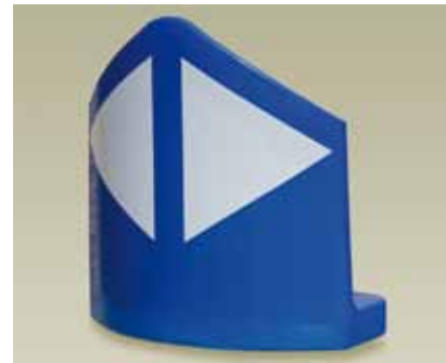
Amplio radio: más visibilidad en oblicuo.