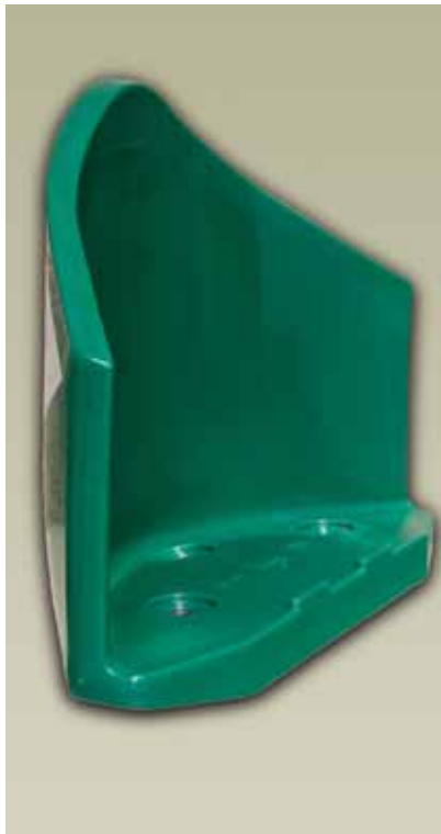
Adiós al engorroso lastre: anclaje directo sobre el firme.